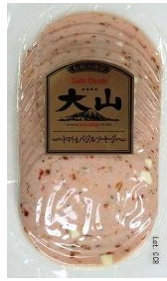
トマト&バジルソーセージ