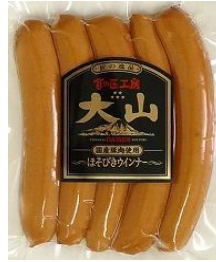
ほそびきウインナー (国産原料使用)