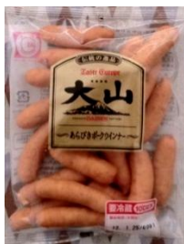
あらびきポーク ウインナー