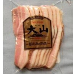
豚ばらの炙り焼き