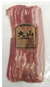
熟成乾塩ベーコン (スライス)