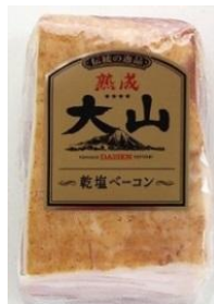
熟成乾塩ベーコン