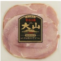
コッホシンケン (国産原料使用)