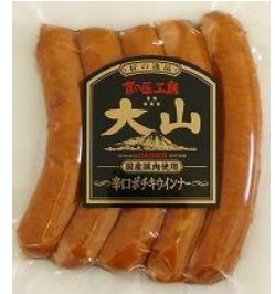
辛口ポチキウインナー (国産原料使用)