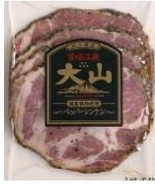
ペッパーシンケン (国産原料使用)