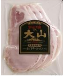
カントリーロースト (国産原料使用)