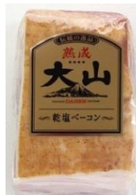
熟成乾塩ベーコン (ブロック)