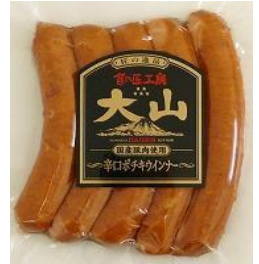
辛口ポチキウインナー (国産原料使用)