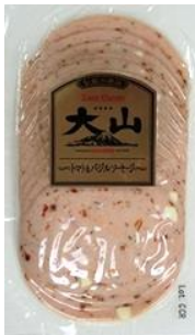
トマト&バジルソーセージ