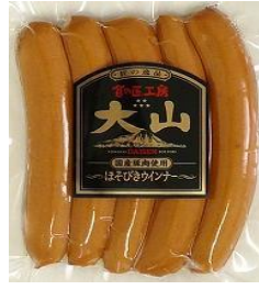
ほそびきウインナー (国産原料使用)