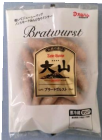
ブラートヴルスト