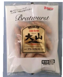
ブラートヴルスト