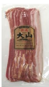
熟成乾塩ベーコン