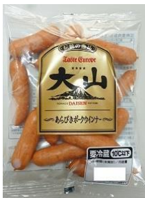
あらびきポークウインナー