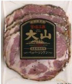
ペッパーシンケン (国産原料使用)