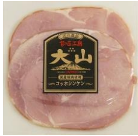
コッホシンケン (国産原料使用)