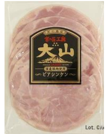
ピアシンケン (国産原料使用)