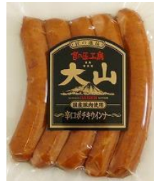
辛口ポチキウインナー (国産原料使用)