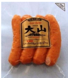
バーベキューソーセージ