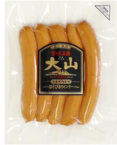
ほそびきウインナー (国産原料使用)