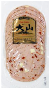
トマト&バジルソーセージ