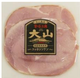
コッホシンケン (国産原料使用)