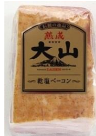
熟成乾塩ベーコン (ブロック)