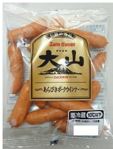
あらびきポークウインナー