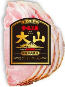
カントリーロースト (国産原料使用)