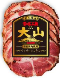
ペッパーシンケン (国産原料使用)