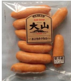
あらびきポークヴルスト